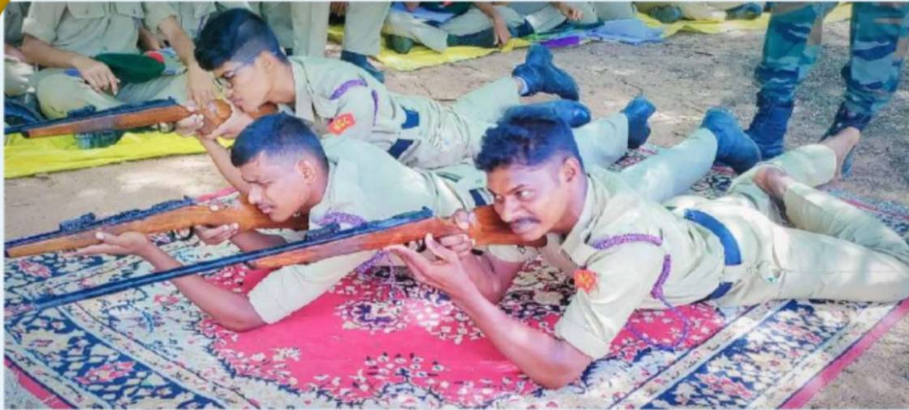
Weapon Training held on 22 August 2024

29(A)Bn, Tirupati has organized NCC Annual Training Camp (ATC) held at NCC Nagara, from 21 August 2024 to 30 August, 2024. In this connection, 35 vacancies were allotted to this college. From this college, 35 NCC cadets (9 Sr Wing and 26 Sr. Division) attended to this camp